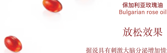
保加利亚玫瑰油 Bulgarian rose oil

已知虾和蟹中含有虾青素 但FLOWERYOU使用的是从红球藻中提取的 植物性原料。