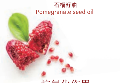
石榴籽油 Pomegranate seed oil